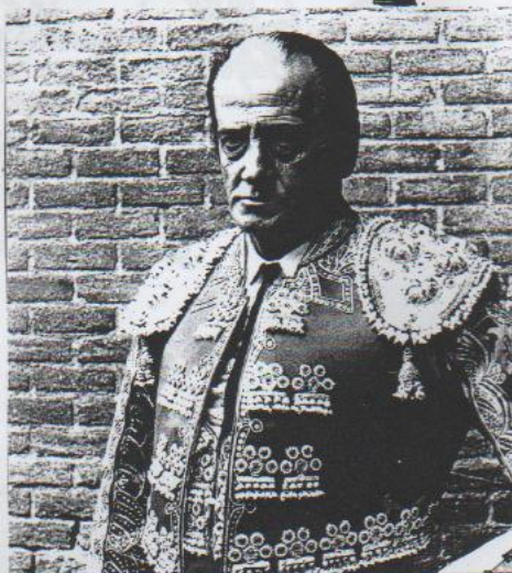
Antonio Chenel "ANTOÑETE"