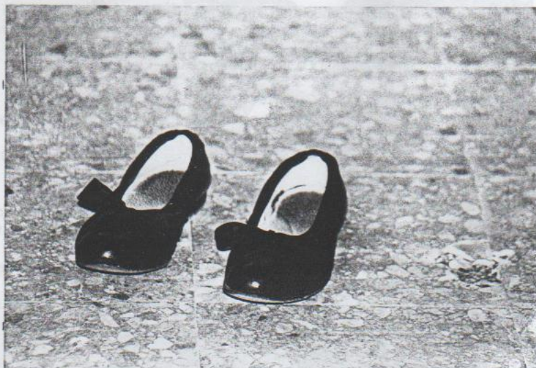
" Las zapatillas que nunca llegaron"

He de contar que la tertulia duro hasta las 2,30 horas de la madrugada y dada la hora avanzada se puso fin a la misma muy a pesar de los contertulios. Y con sinceridad pienso que NO ECHAMOS DE MENOS A NADIE.